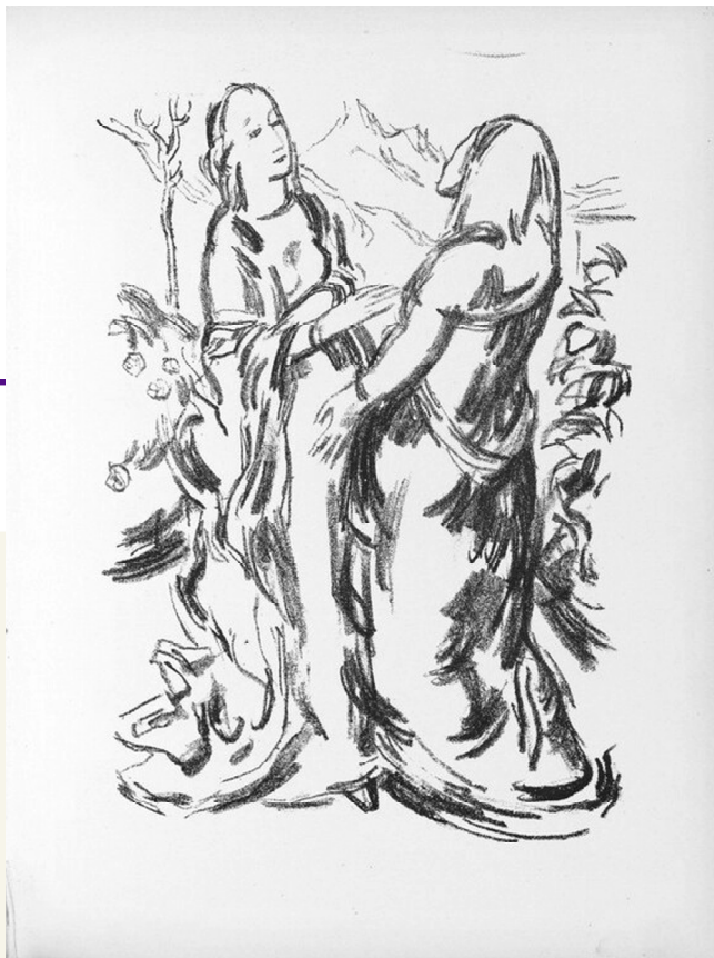
Visitazione di Karl Caspar, 1917, National Gallery of Art, Washington D.C.