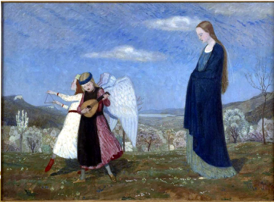
Maria cammina sulla montagna, di Karl Caspar, 1904, Collezione privata, foto tratta da https://www.invaluable.com